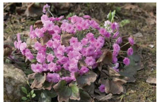
Triskiautės žibuoklės rožinė pilnavidurė (Rosea plena) veislė.