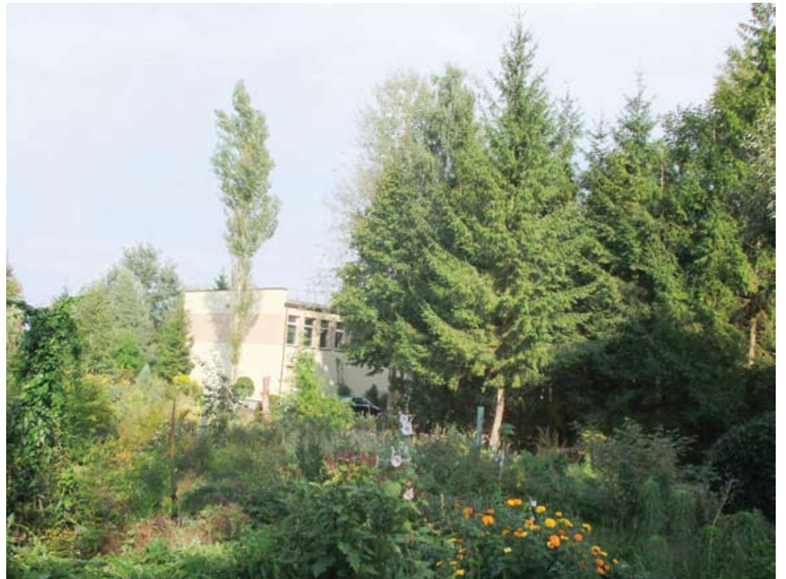
Želdynuose skendinti Traupio mokykla.