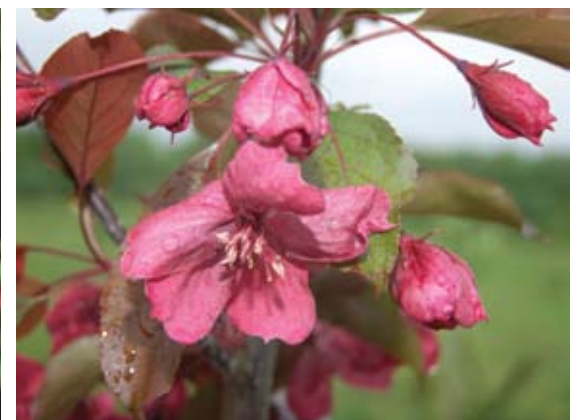
Dekoratyvinės obels veislė „Macamic“.

traupietis yra visa galva geresnis žmogus už statistinį lietuvi. Nes sodas neaptvertas, jame žydi įvairiausi augalai, o jų niekas neskina, nelaužo, nevagia, neniokoja čia sukurtos infrastruktūros, maža to, jeigu bandysite tai daryti, budriakis pamatys ir sudraus. Žinoma, daugelis traupiečių sodą laiko savo įžymybe, progai pasitaikius atveda čia svečius. Pagaliau sodo želdynai integrovosi į miestelio želdinius, tad oras čia visada vaiskus, nuolat galima užuosti žydinčių augalų aromatus, girdėti paukščių, žiogų ir varlių koncertus.