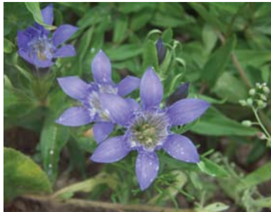
Bestiebis gencijonas - iš Pirėnų ir Balkanų kalnų kilusi gėlė.