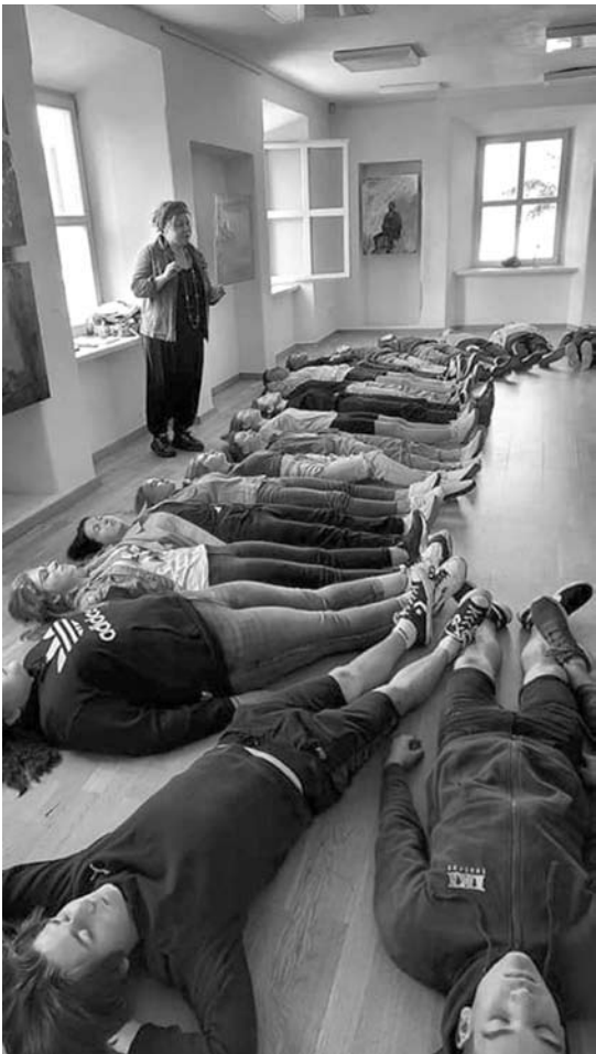
Festivale - edukacinėje stovykloje „Troškimai“ kasmet dalyvauja apie 50 jaunuolių iš visos Lietuvos.