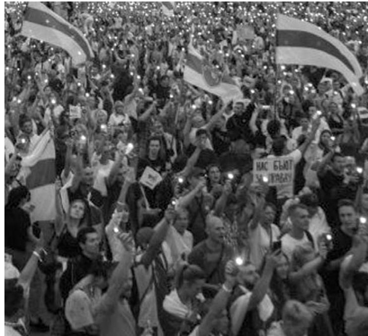
Į gatves Baltarusijoje išėjo šimtai tūkstančių žmonių.

Pradžioje vyras buvo nusprendęs „Anykštos“ skaitytojams pristatyti pavarde, bet vėliau, pasikalbėjęs su partneriais iš Baltarusijos, dėl visa pikta nutarė likti anonimiškas.