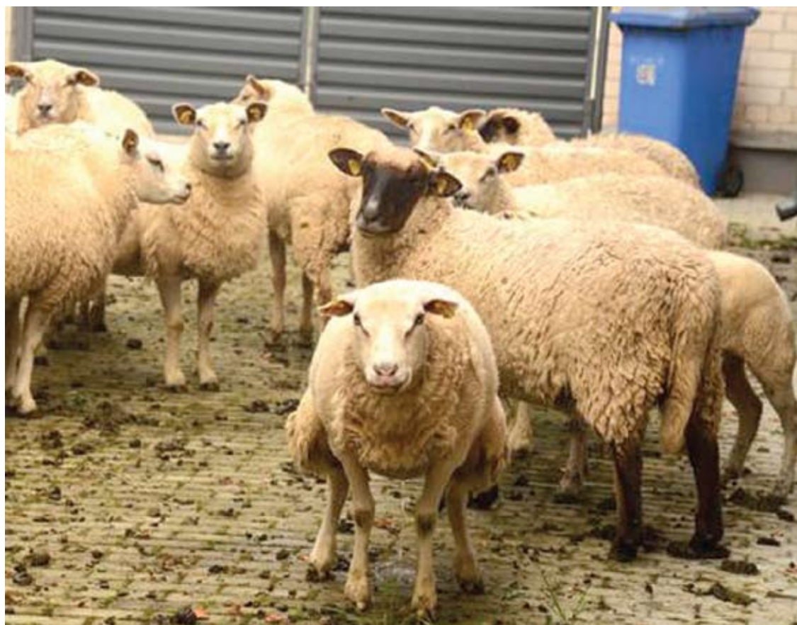
Praėjusį savaitgalį ir savaitės pradžioje vilkai išplovė 28 Anykščių rajono ūkininkų avis.

Vidmantas ŠMIGELSKAS vidmantas.s@anyksta.lt