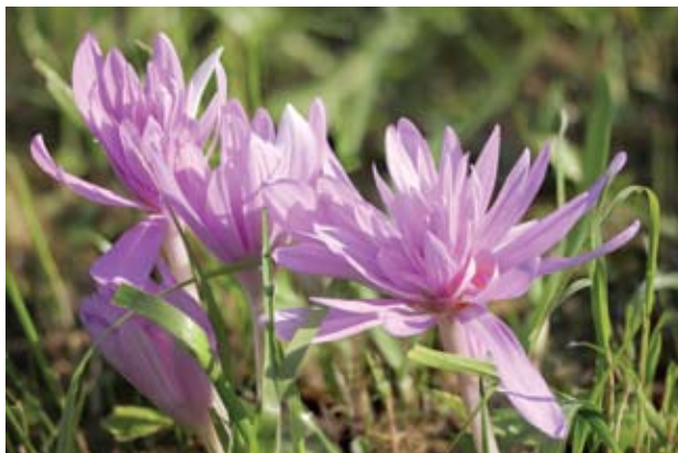
Puošniojo vėlyvio veislė „Waterlily“.