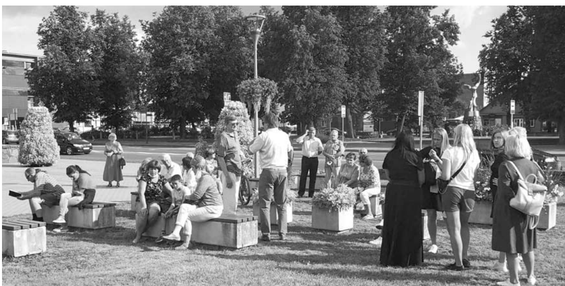
Anykštėnai svečiui turėjo aibę klausimų, todėl renginys labiau priminė diskusiją nei į paskaitą.